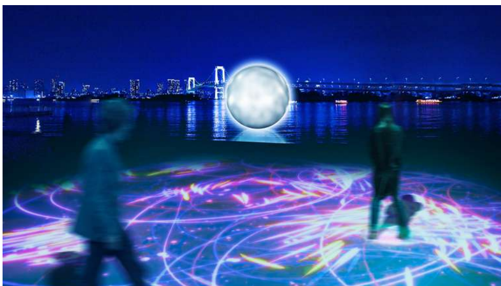
月が満ち欠けて行くように、時の経過と共に変化する月