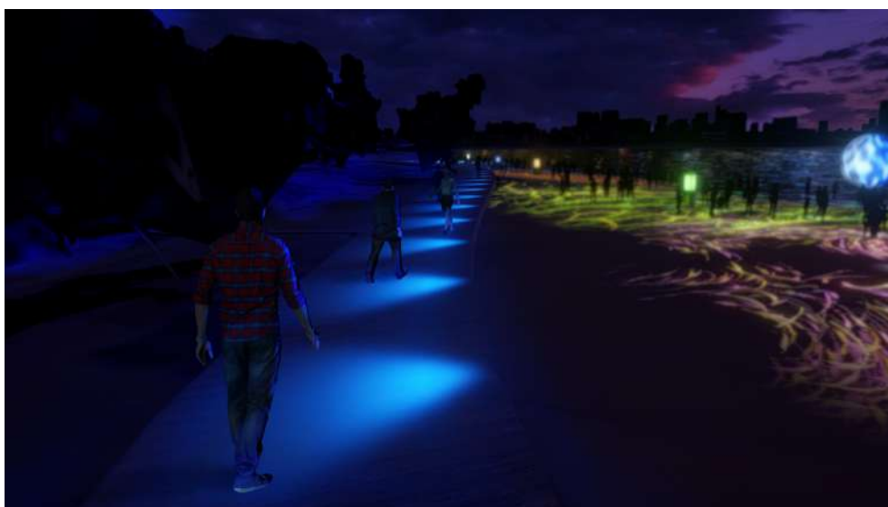
光と音に彩られた砂浜へと誘う「光の道しるべ」