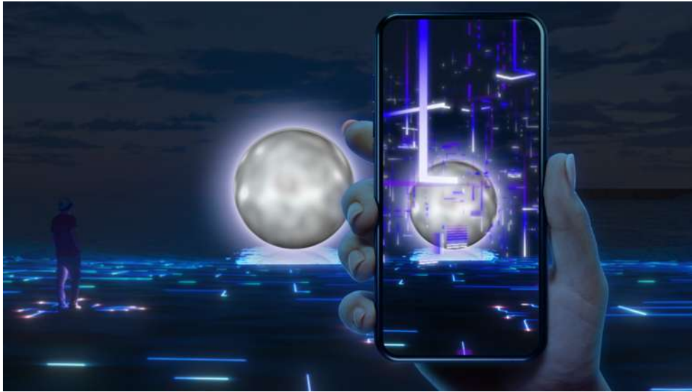
来場者のスマートフォンで楽しめる AR 体験イメージ