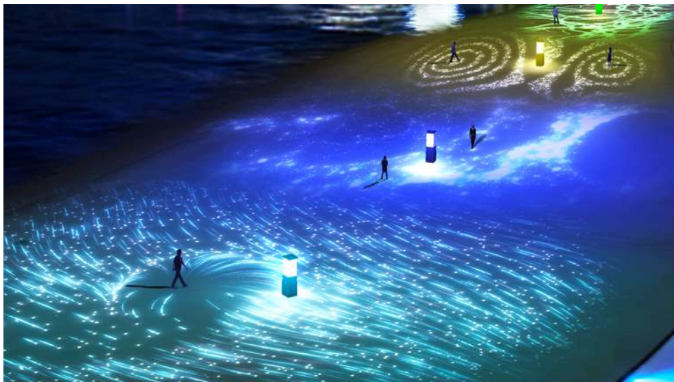
手前から Ventus (風) ・ Aqua (水) ・ Tera (大地) エリア