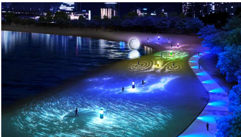
6つのプロジェクションエリア全体イメージ

お台場の海辺に浮かぶ美しい月を中心に、国内最大級である約3,000㎡のビーチで光と音が織りなす幻想的な体験を楽しむことができます。